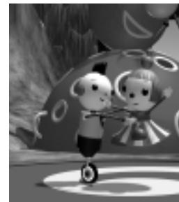
Rolie Polie Olie NELVANA

Nelvana continue d'incarner la puissance en animation afin de rehausser les barrières de l'imagination et de créer de nouvelles avenues pour le divertissement.